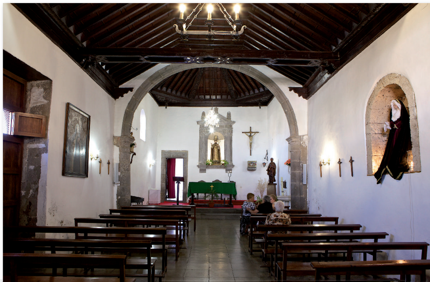
① Interior del templo.

En la actualidad este templo se celebra la misa de rito ortodoxo.