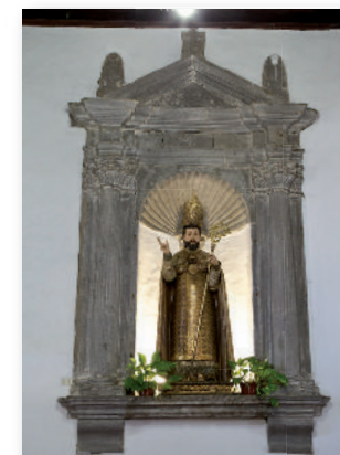
③ San Nicolás de Bari.