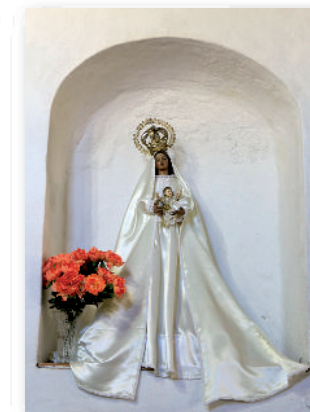
④ Nuestra Señora de Loreto.