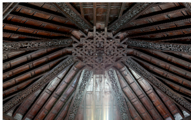
② Techo cubierto con un sencillo artesonado.